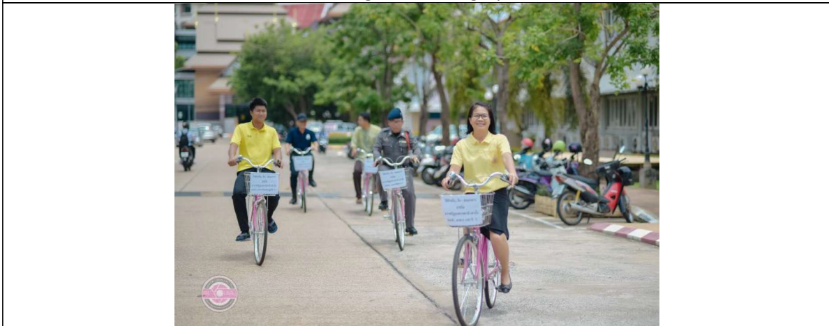
UBRU bicycles (free of charge)