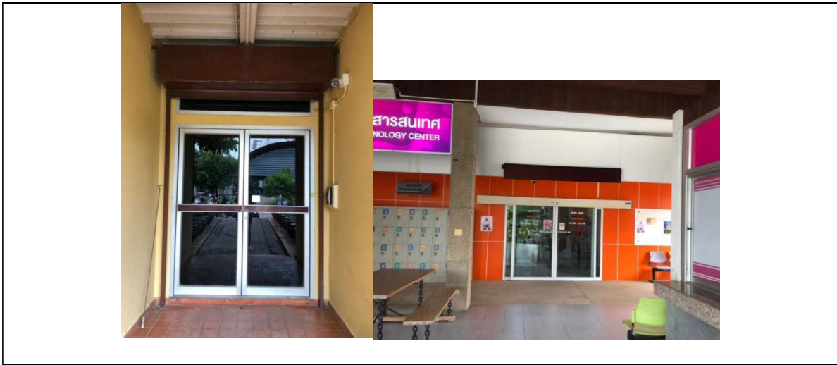
Automatic Sliding Doors / Fingerprint Scanner