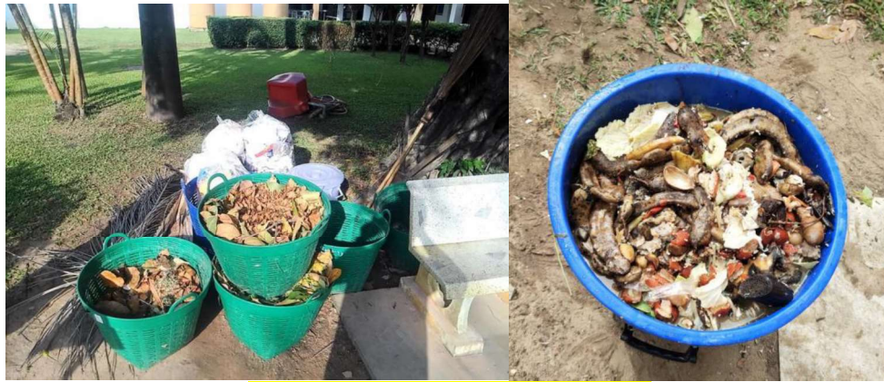
Example of Waste produced at UBRU