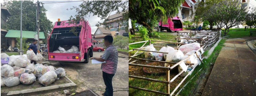
The sorting of general waste and the collection of general waste to Warinchamrap landfill.