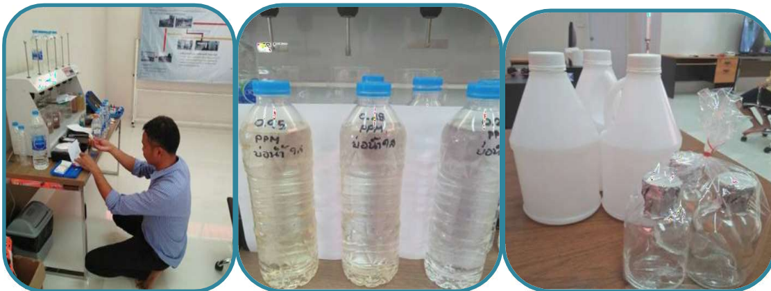
Weekly water quality check