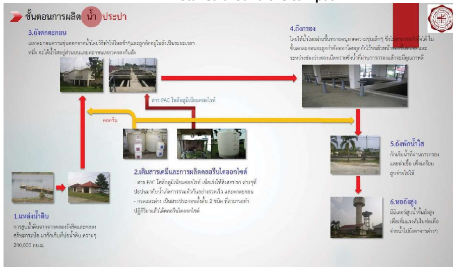
The process of water production run by the university